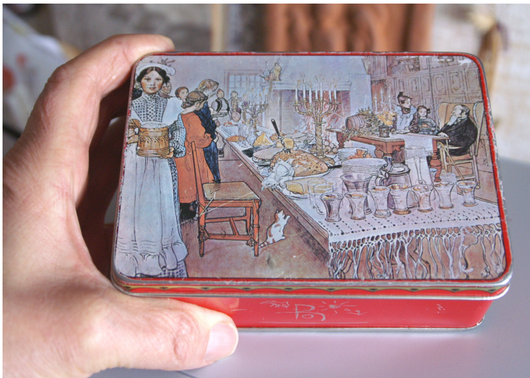
Min madkasse med Carl Larsson motiv

Engang for mange år siden - efter i nogen tid at have beskæftiget mig med den hollandske maler Jan Vermeer - fandt jeg på at sprede de kære bøger om ham ud på gulvet, alle slået op på gengivelsen af det samme billede - og indså straks, at der var noget helt fundamentalt, jeg var gået glip af. Jeg havde bildt mig ind at vide, hvordan hans billeder så ud, men måtte erkende, at det helt fundamentale: farven - anede jeg ikke et klap om.