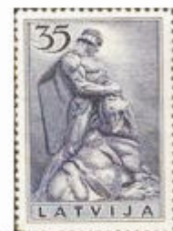
2. sang Frihedsmonument med Bjørnedræbermotiv (1937)