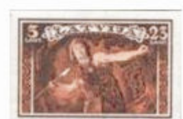
3. sang: Bjørnedræberen (1932)