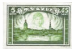
5. sang: Bjørnedræberen over Riga (1932)